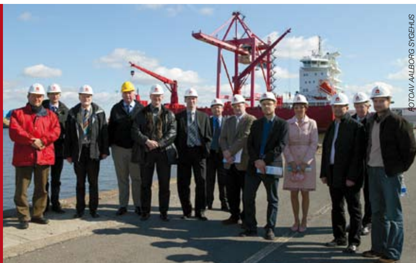
FOTOAV AALBORG SYGEHUS

Repræsentanter for Aalborg Amt, Aalborg Sygehus og Centeret for Grønlandsforskning og Royal Arctic Line A/S, Arctic Container Operations A/S, og Aalborg Havn A/S under rundvisningen.