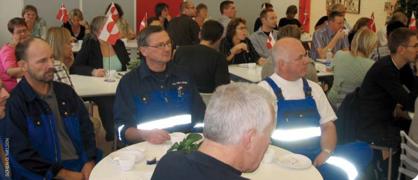
▲ ACO-mi RALIN-imilu sulisut / Medarbejderne i ACO og RALIN