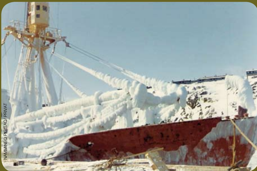
NAMMINEO PIGISAO/ PRIVAT